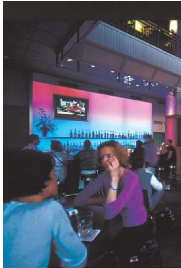
Anderes Lokal, anderer Look: Die «News-Bar» in Zürich wurde von Aberegg mit viel High-Tech ausgestattet.