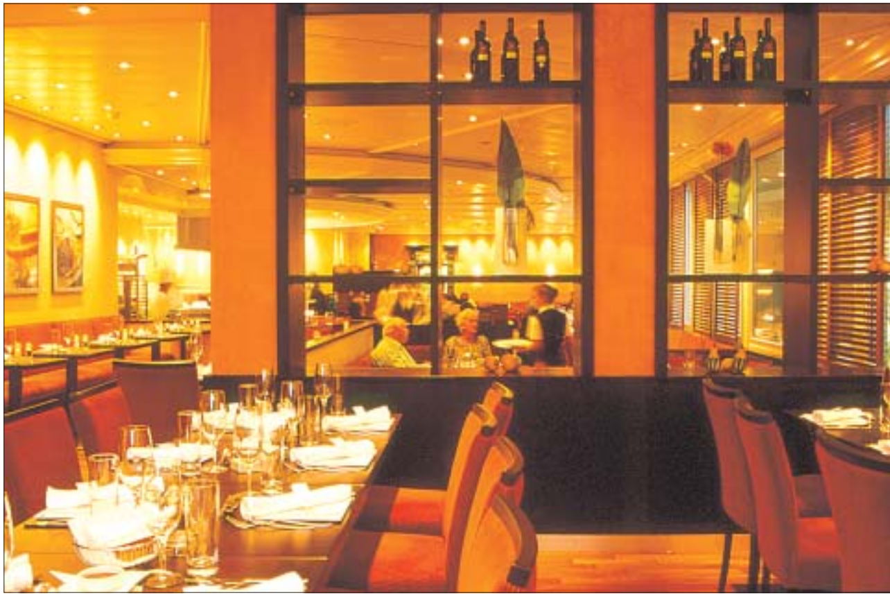
Klare Linien, einfache Formen, warme Farben: Das von Christoph Aberegg neu gestaltete Mövenpick Restaurant in Glattbrugg begeistert sowohl die Gäste wie auch die Mövenpickler.

Vor den Fenstern wurden Mini-Zypressen gepflanzt, die einen Hauch Italianità verbreiten. Und das Licht passt sich automatisch den Witterungsbedingungen an – High-Tech, die man fast nicht bemerkt. Ein Holzgestell mit austauschbaren Tablaren schafft Abgrenzung und Blickfang zugleich. Aberegg versteht es, mit einfachen Mitteln Grosses zu schaffen. Er ist ein Experte, ein Profi, einer, auf den man sich bei der Arbeit verlassen kann.