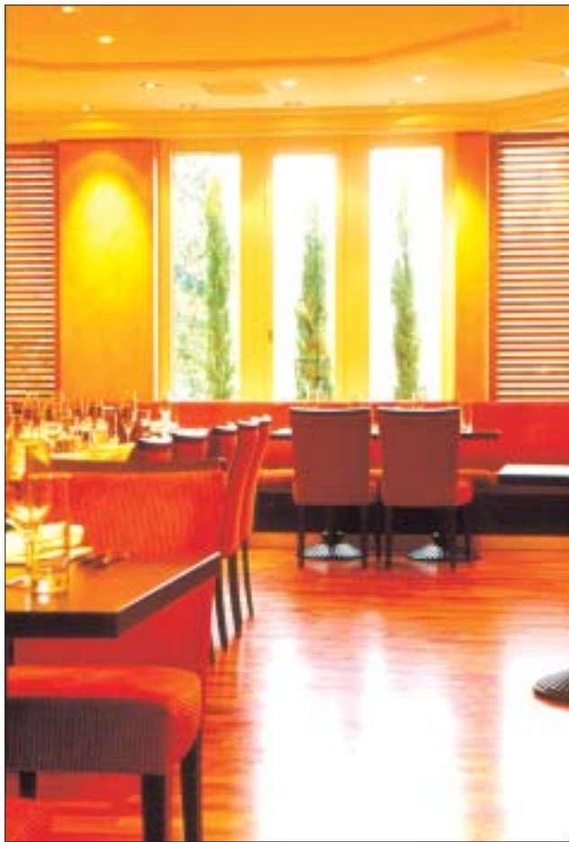
Der Besucher wähnt sich in Italien: Zypressen vor den Fenstern verströmen südländisches Ambiente.