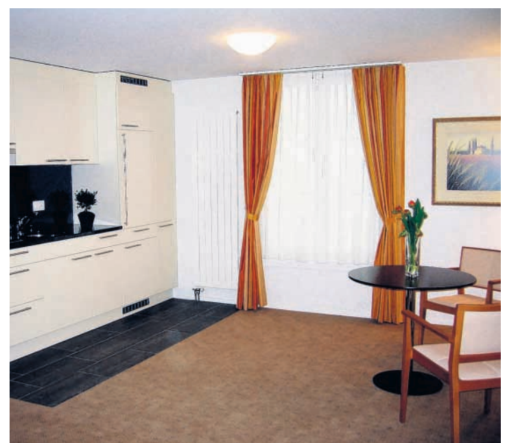
Appartement mit Küchenabteil.