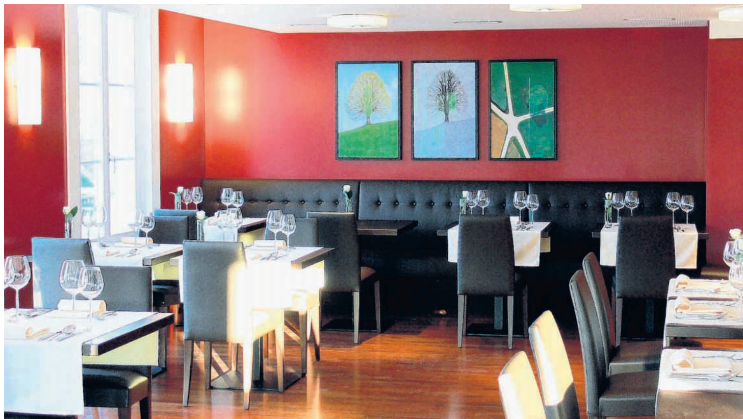
Das Restaurant Ebnet mit À-la-carte-Küche und gediegener Atmosphäre ist auch für Nichtbewohner offen.