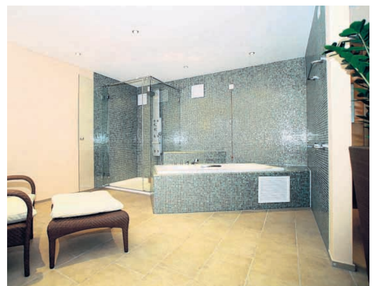
Bad und Wellness im Haus Ebnet.