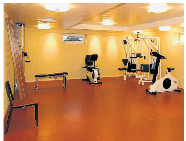
Fit im Alter: Geräte dazu sind vorhanden.